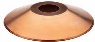
Schirm Kupfer flach Ø 350 mm, Höhe 50 mm. Bestell-Nr. 101211

Die Basis der THPG-Leuchtenbaukästen sind unsere materialästhetisch überlegenen und elektrotechnisch vertrauenswürdigen Sockel und Fassungen, die Ihnen bereits auf den vorangegangenen Seiten begegnet sind. Diese lassen sich anhand des Durchmessers ihrer Innengewinde in zwei Gruppen aufteilen: MINIMAL und MEDIUM. Die MINIMAL-Fassungen können mit passenden Schirmen (folgende Doppelseite), die MEDIUM-Sockel mit passenden Schirmen und Gläsern (auf dieser Seite) kombiniert werden. Wenn Sie außerdem die von Ihnen bevorzugten Kabel und Baldachine hinzuwählen, erhalten Sie eigenkomponierte Leuchten, die sich in Gestalt und Lichtwurf deutlich voneinander unterscheiden. Oft genügt schon eine Variation im Detail, um einen anderen Gesamteindruck zu erzeugen oder die Leuchte besser in ihre künftige Umgebung zu integrieren.