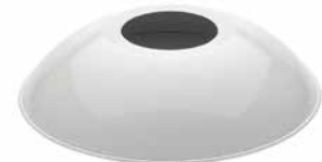
Schirm Stahlblech rundgebogen weiß Ø 260 mm, Höhe 60 mm. Bestell-Nr. 101253