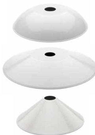
Schirm Stahlblech rundgebogen weiß Ø 260 mm, Höhe 60 mm. Bestell-Nr. 101251