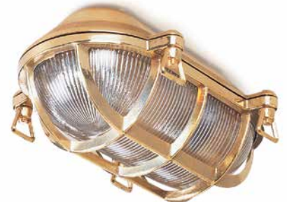
Kellerleuchte Messing groß Länge 230 mm, Breite 160 mm, Höhe 110 mm. Gewicht 1800 g. Porzellanfassung E 27, max. 60 W. IP54. Bestell-Nr. 130749

Für diese Leuchten gilt: Gehäuse und Schutzkorb aus Aluminiumguss, Einsatz aus satiniertem Glas. Lieferung ohne Leuchtmittel. Innensechskantschlüssel wird mitgeliefert.