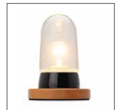
Tischleuchten Seite 13-15