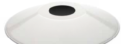
Schirm Stahlblech flach weiß Ø 350 mm, Höhe 50 mm. Bestell-Nr. 101257