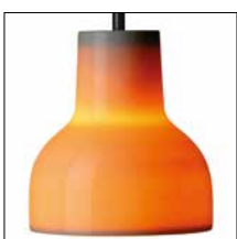
Dänische Porzellanleuchten Seite 16