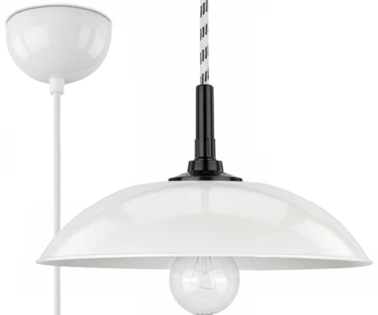
Hängeleuchte MINIMAL Bakelit (101191) mit Kabel weiß/schwarz (900534) und Schirm MINIMAL Stahlblech gebogen weiß (101251)