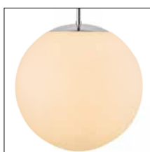
Triplex- Opalglasleuchten Seite 17