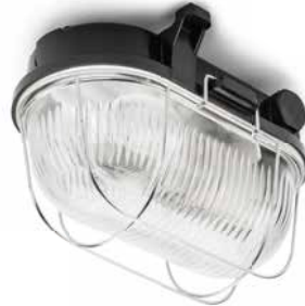
Kellerleuchte THPG Bakelit oval groß Länge 195 mm, Breite 135 mm, Höhe 115 mm. Gewicht 700 g. Porzellanfassung E27, max. 100 W. IP54. Bestell-Nr. 100501