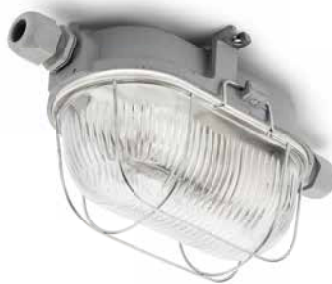
Kellerleuchte THPG Gusseisen grau oval groß Länge 195 mm, Breite 135 mm, Höhe 115 mm. Gewicht 1700 g. Porzellanfassung E27, max. 100 W. IP54. Bestell-Nr. 100506