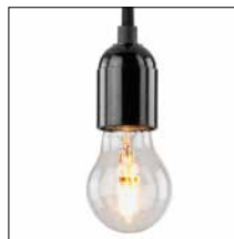
THPG- Minimalleuchten Seite 8-9