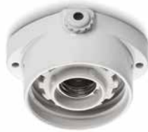
Deckensockel LISILUX weiß M Ø 95 mm, Höhe 50 mm. Bestell-Nr. 100751