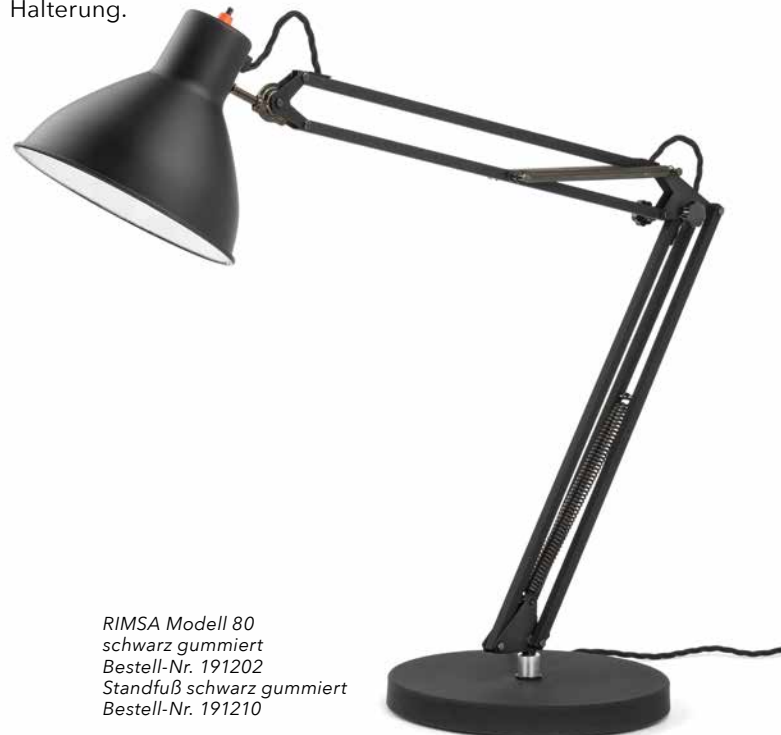
RIMSA Modell 80 schwarz gummiert Bestell-Nr. 191202 Standfuß schwarz gummiert Bestell-Nr. 191210