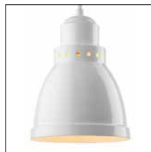
THPG- Hängeleuchten und -Wandstrahler Seite 7 & 10-11