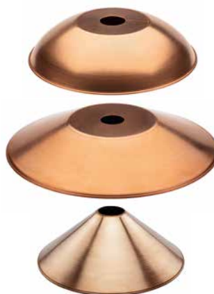
Schirm Kupfer rundgebogen Ø 260 mm, Höhe 60 mm. Bestell-Nr. 101202

Schwarze Bakelitfassung mit 1,5 m langem Textilkabel in Schwarz. E27, max. 60 W. Mit Zugentlastung und Zugschalter. Bestell-Nr. 101180