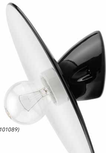
Wandfassung MINIMAL Porzellan s/w (152656) mit Schirm MINIMAL Stahlblech emailliert schwarz klein (101089)

Hier können Sie drei unserer auf Seite 9 vorgestellten MINIMAL-Hängeleuchten sowie unsere MINIMAL-Wand- und Deckenfassungen aus Porzellan mit elf verschiedenen Kupfer- und Stahlblechschirmen kombinieren. Das 1,5 Meter lange Kabel der Hängeleuchten kann durch eine andere Farbe ersetzt und in der Länge angepasst werden. Diese Optionen sowie passende Baldachine aus Porzellan finden Sie auf Seite 9.