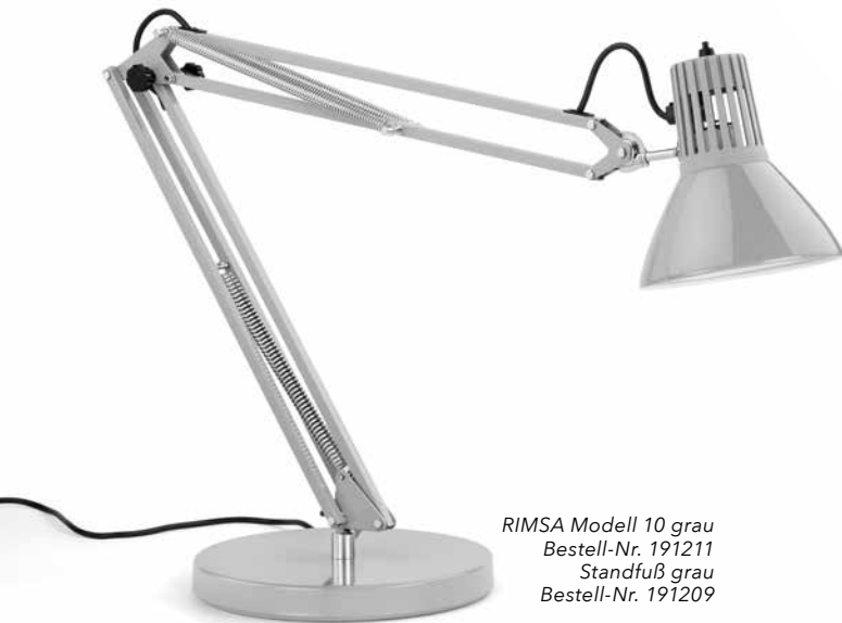
RIMSA Modell 10 grau Bestell-Nr. 191211 Standfuß grau Bestell-Nr. 191209

Bauform zu retten, aber teils zu extrem hohen Preisen. Wir bringen den italienischen Urtyp, bis heute hergestellt von RIMSA, einem italienischen Hersteller, der für uns »neue Originale« seiner Gelenkleuchten aus den Jahren 1946 und 1964 baut. Dank der patentierten, seit 1946 produzierten Stahlgelenkpfanne am oberen Ende des Arms ist der Leuchtenkopf großzügig schwenkbar. Der Lichtkegel lässt sich leicht und stufenlos in beinahe jedem Winkel fixieren, um die gewünschte Stelle zentimetergenau auszuleuchten. Wir führen die folgenden drei Modelle von RIMSA. Bestellen Sie bitte die Lampe in der Farbe Ihrer Wahl und eine gewünschte Halterung.