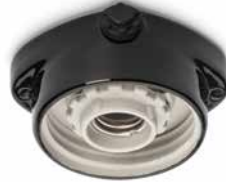
Deckensockel LISILUX schwarz M Ø 95 mm, Höhe 50 mm. Bestell-Nr. 101247

Die MEDIUM-Sockel können Sie mit sechs Schirmen und fünf verschiedenen Gläsern kombinieren; allein daraus ergeben sich theoretisch 240 Kombinationsmöglichkeiten, die wir Ihnen hier nur in einer kleinen Auswahl zeigen können. Die MINIMAL-Fassungen bieten wir mit elf verschiedenen gedrückten Kupfer- und Stahlblechschirmen an. Zu jeder Hängeleuchte wird standardmäßig ein 1,5 Meter langes schwarzes Textilkabel mitgeliefert.