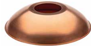
Schirm Kupfer rundgebogen Ø 260 mm, Höhe 60 mm. Bestell-Nr. 101205