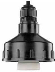
Hängeleuchte THPG Bakelit M Max. 60 W. Porzellanfassung E27. Bestell-Nr. 101183