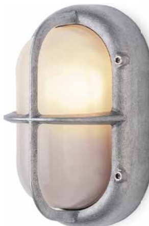
Wandleuchte Aluminium rund Durchmesser 210 mm, Tiefe 95 mm. Gewicht 1100 g. Porzellanfassung E 27, max. 60 W. IP45. Bestell-Nr. 165252