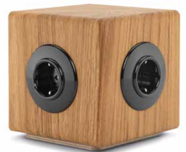
THPG-Stromwürfel (Seite 26)