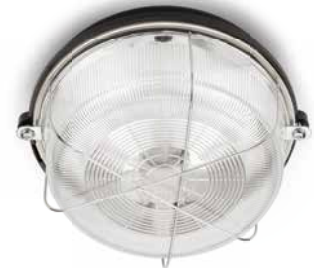
Kellerleuchte THPG Bakelit rund Ø 200 mm, Höhe 115 mm. Gewicht 700 g. Porzellanfassung E27, max. 100 W. IP54. Bestell-Nr. 100499