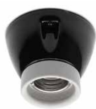
Deckenfassung THPG MINIMAL Porzellan schwarz, Klemmring weiß

Porzellansockel in gerader Form. Max. Ø 75 mm, Höhe 60 mm. Gewicht 200 g. Bestell-Nr. 152649