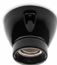
Deckenfassung THPG MINIMAL Porzellan schwarz

Porzellansockel in gerader Form. Max. Ø 75 mm, Höhe 60 mm. Gewicht 200 g. Bestell-Nr. 152643