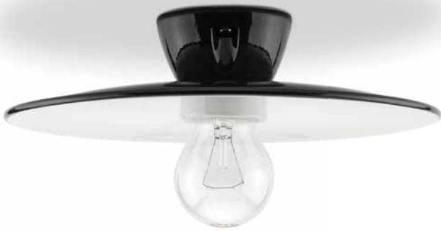
Deckenfassung MINIMAL Porzellan s/w (152655) mit Schirm MINIMAL Stahlblech emailliert schwarz groß (101088)