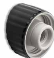
Wandsockel THPG Porzellan schwarz M Ø 106 mm, Ausladung 60 mm. Bestell-Nr. 177035