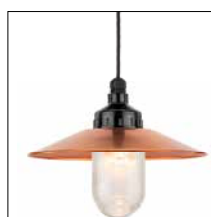
Leuchtenbaukästen Seite 20-23