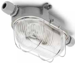
Kellerleuchte THPG Gusseisen grau oval klein Länge 170 mm, Breite 125 mm, Höhe 115 mm. Gewicht 1300 g. Porzellanfassung E27, max. 60 W. IP54. Bestell-Nr. 100503

Glasschirm. Die Kellerleuchte ist zudem als leichtere, jedoch keineswegs fragile Variante aus Bakelit erhältlich; ihren schweren gusseisernen Geschwistern ist diese in puncto Staub- und Feuchtigkeitsschutz vollkommen ebenbürtig. Die IP-Schutzklasse entnehmen Sie bitte der jeweiligen Leuchte.