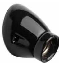
Wandfassung THPG MINIMAL Porzellan schwarz

Porzellansockel in angeschrägter Form. Max. Ø 75 mm, Ausladung 85 mm. Gewicht 200 g. Bestell-Nr. 152647