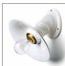
Leuchten aus Venetien Seite 18-19