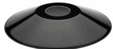
Schirm Stahlblech flach schwarz Ø 350 mm, Höhe 50 mm. Bestell-Nr. 101256