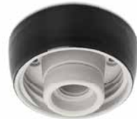
Deckensockel THPG Porzellan schwarz M Ø 108 mm, Höhe 60 mm. Bestell-Nr. 177034