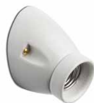
Wandfassung THPG MINIMAL Porzellan weiß

Porzellansockel in angeschrägter Form. Max. Ø 75 mm, Ausladung 85 mm. Gewicht 200 g. Bestell-Nr. 152647