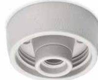
Deckensockel THPG Porzellan weiß M Ø 108 mm, Höhe 60 mm. Bestell-Nr. 177026