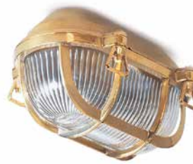
Kellerleuchte Messing klein Länge 200 mm, Breite 130 mm, Höhe 105 mm. Gewicht 1300 g. Porzellanfassung E 27, max. 60 W. IP54. Bestell-Nr. 130748

Diese schwere, robuste Leuchte wird in Italien aus Messing gegossen und ist nicht allein optisch, sondern in ihrer soliden Verarbeitung tatsächlich den extremen Erfordernissen der rauen Seefahrt gewachsen: Gehäuse und Gitterkorb sind aus massivem, poliertem Messing, absolut korrosionsfest und widerstandsfähig gegen Verwitterung.