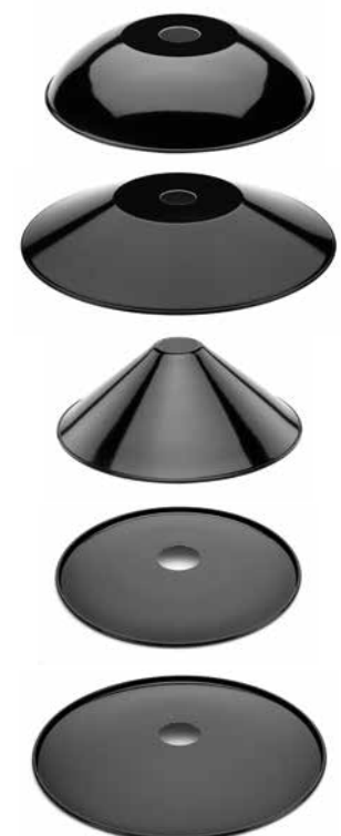
Schirm Stahlblech rundgebogen schwarz Ø 260 mm, Höhe 60 mm. Bestell-Nr. 101250

Porzellansockel in angeschrägter Form. Max. Ø 75 mm, Ausladung 85 mm. Gewicht 200 g. Bestell-Nr. 152656