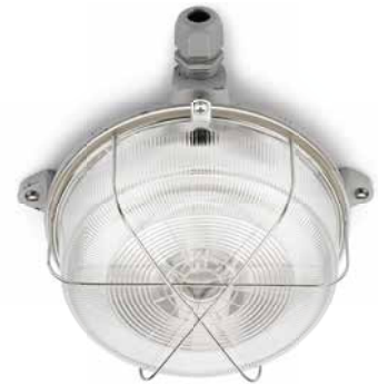
Kellerleuchte THPG Gusseisen grau rund Ø 200 mm, Höhe 100 mm. Gewicht 2300 g. Porzellanfassung E27, max. 100 W. IP54. Bestell-Nr. 100502