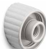
Wandsockel THPG Porzellan weiß M Ø 106 mm, Ausladung 60 mm. Bestell-Nr. 177027