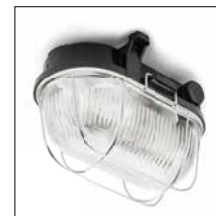
Keller- und Außenleuchten Seite 12