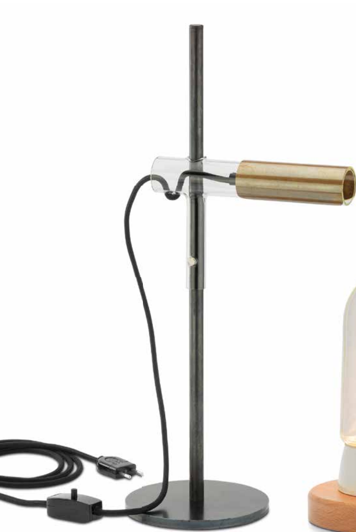
THPG-Glaskolbenleuchte (Seite 13)