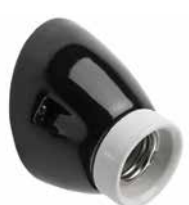
Wandfassung THPG MINIMAL Porzellan schwarz, Klemmring weiß

Porzellansockel in angeschrägter Form. Max. Ø 75 mm, Ausladung 85 mm. Gewicht 200 g. Bestell-Nr. 152651