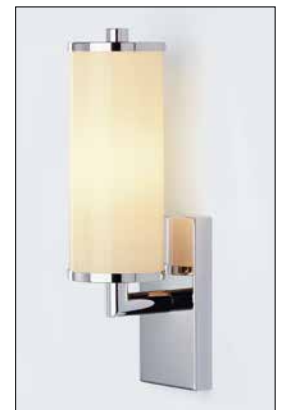
Wandleuchte Triplex-Opalglas einflammig

Messing verchromt. Glaszylinder Ø 80 mm, Gesamthöhe 315 mm, Ausladung 115 mm. Wandbefestigung 80 mm x 150 mm. Gewicht 840 g. E14, max. 40 W.