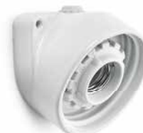
Wandsockel LISILUX weiß M Ø 95 mm, Ausladung 60 mm. Bestell-Nr. 100758