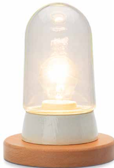
THPG-Sockelleuchten (Seite 14)