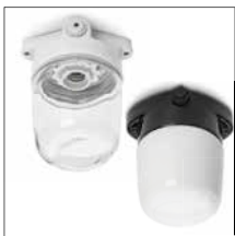
LISILUX- Zweckleuchten Seite 3-5