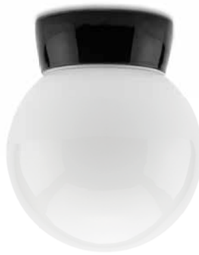
Decken- und Wandleuchte THPG Porzellan schwarz (Seite 6)