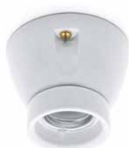
Deckenfassung THPG MINIMAL Porzellan weiß

Porzellansockel in gerader Form. Max. Ø 75 mm, Höhe 60 mm. Gewicht 200 g. Bestell-Nr. 152643