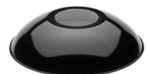
Schirm Stahlblech rundgebogen schwarz Ø 260 mm, Höhe 60 mm. Bestell-Nr. 101252

Passende Baldachine aus Porzellan und Optionen zur Anpassung von Kabellänge und -farbe finden Sie auf Seite 9.