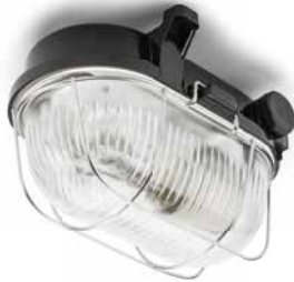
Kellerleuchte THPG Bakelit oval klein Länge 170 mm, Breite 125 mm, Höhe 115 mm. Gewicht 550 g. Porzellanfassung E27, max. 60 W. IP54. Bestell-Nr. 100500