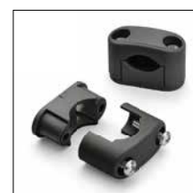
Zubehör und Ersatzteile Seite 24-25