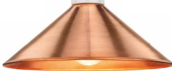
Hängeleuchte MINIMAL Porzellan weiß (101178) mit Schirm MINIMAL Kupfer Kegel (101214) und Baldachin THPG Porzellan weiß (101090)