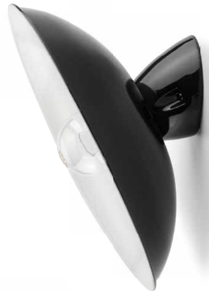
Wandfassung MINIMAL Porzellan schwarz (152651) mit Schirm MINIMAL Stahlblech gebogen schwarz (101250)