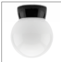
THPG- Porzellanleuchten Seite 6