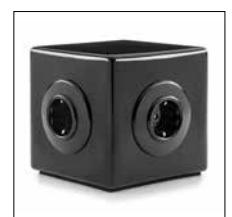
Mehrfachstecker Seite 26